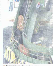
Maniobras de embarque.

Las exportaciones de ganado en pie hacia El Líbano, que empiezan esta semana por el Puerto de Mamonal, se iniciarán en febrero de este año a través del Puerto de Barranquilla, con cerca de 2.800 reses. Los exportadores decidieron trasladar esa operación a Cartagena por las mejores condiciones del puerto local, que cuenta con un mejor calado natural en su bahía, lo que permite el acceso a los muelles de Puerto de Mamonal de embarcaciones de mayor capacidad. Adicionalmente, Cartagena está más cerca de los centros de producción de donde provienen los animales, lo que en materia de costos de transporte se convierte en una gran ventaja para el exportador.