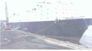
Trigger, la embarcación especializada en el transporte de bovinos vivos, es la encargada de llevar las reses a la República de El Líbano.

Para garantizar los aspectos fitosanitarios que demanda una operación de este tipo, 8 profesionales del Instituto Colombiano Agropecuario (ICA), perteneciente a varias seccionales del país, liderados por la Unidad Portuaria del ICA en Cartagena, controlarán riguro-