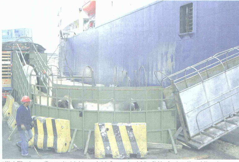
Más de 700 camiones se utilizan para el traslado de las reses desde las fincas ganaderas de Bolívar, Córdoba y Sucre hasta el Puerto de Mamonal.

Cambio de imagen La empresa Kokoriko eligió a Barranquilla para presentar su nueva imagen y concepto renovado. El acto se realizará el 20 de octubre, a las 12 del día en el Kokoriko La Torcoroma, de la capital del Atlántico.