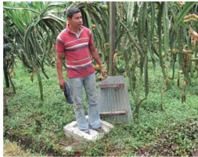
Figura 25 .Desinfección de calzado antes de ingresar al lote.