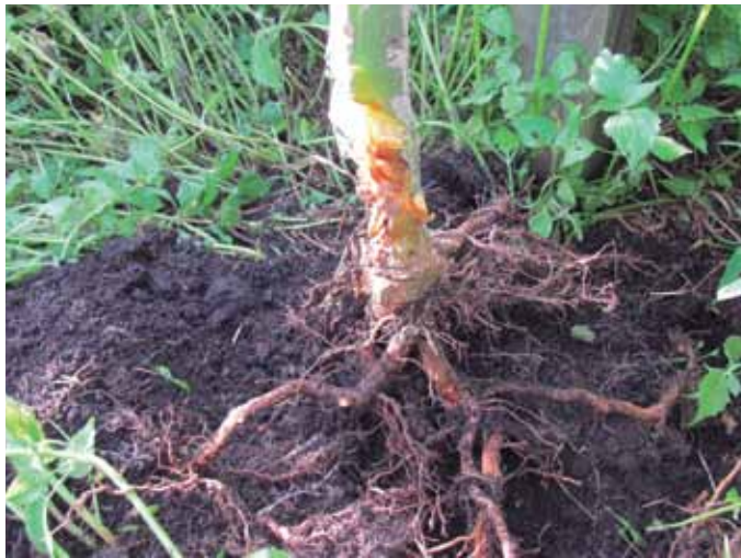
Figura 17. Plantas afectadas.

Es un hongo cuyo óptimo desarrollo se presenta a temperaturas de 20° C, con un rango de 12 a 28° C; en condiciones de alta humedad relativa y días cortos de baja intensidad lumínica se favorece su desarrollo. Los cultivos establecidos en suelos ácidos, arenosos, con bajo pH, pobres en nitrógeno son propicios a la enfermedad (Gonzales, 2006).