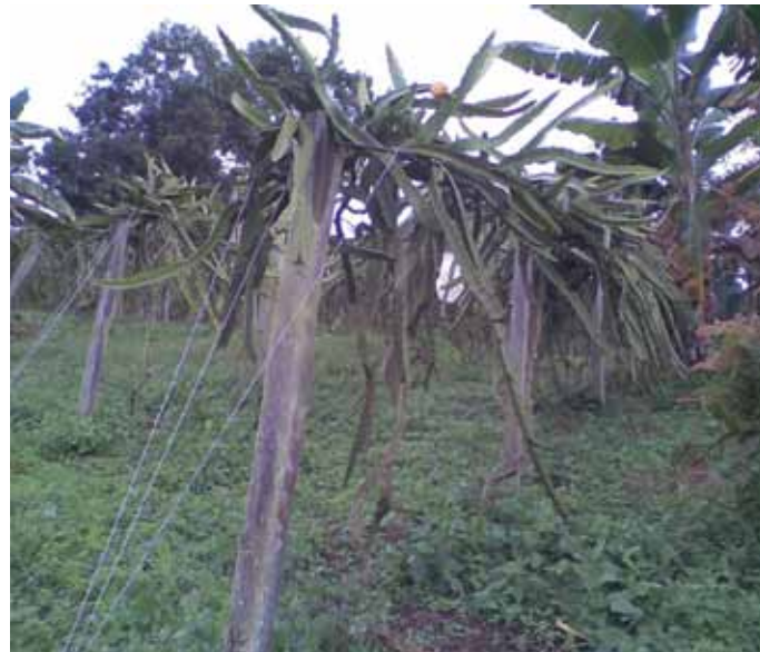
Figura 9. Tutorado.

Las plantas de pitahaya requieren por su arquitectura un sistema de tutorado, la más común es la de espaldera en T. El tutor puede ser un poste de madera o de cemento.