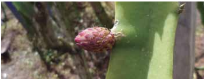
Figura 4. Botón floral.