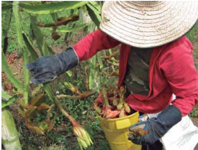
Figura 26. Recolección de botones florales afectados por mosca.