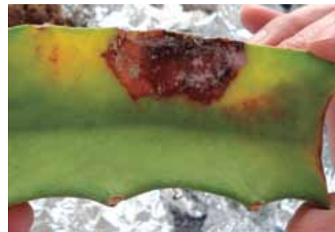
Figura 16. Síntomas en penca.