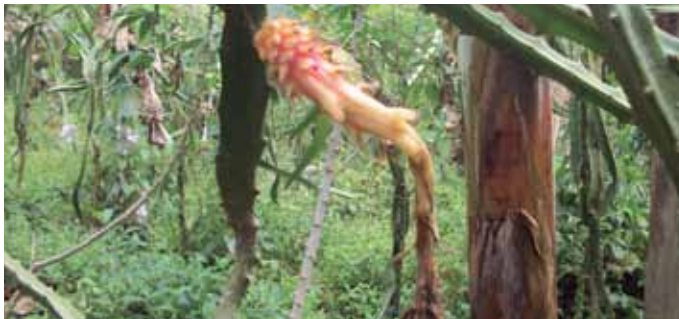
Figura 6. Fruto en formación.