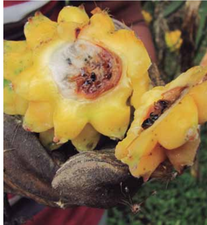
Figura 15. Fruto afectado.

Los primeros síntomas son pequeñas manchas de color entre amarillo y marrón, que dan lugar, en condiciones favorables, a una pudrición blanda (Hyo Won et al, 2007). En los frutos se presentan, inicialmente, en el pedúnculo; cuando hay un alto grado de severidad la enfermedad puede ocasionar su caída. En Colombia se han encontrado incidencias de hasta el 29,3% (Araujo y Medina, 2008). Las pencas presentan lesiones de color amarillo, que luego se ponen de color marrón. Los síntomas en el tallo principal consisten en una pudrición blanda que se inicia cerca a la superficie del suelo, se desarrolla en forma ascendente y puede causar la muerte de la planta (Wright et al, 2007). Las heridas ocasionadas a las raíces por maquinaria o la afección de nematodos aumentan la susceptibilidad al marchitamiento y favorecen el desarrollo del hongo.