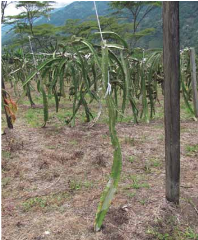
Figura 10. Tutorado inicial