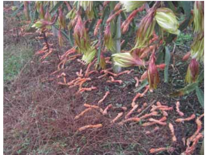
Figura 8. Aborto floral.

Por otra parte, la alta humedad en el suelo dificulta la disponibilidad de oxígeno para las raíces, lo que puede generar una predisposición y una puerta de entrada para los patógenos que habitan en el suelo.