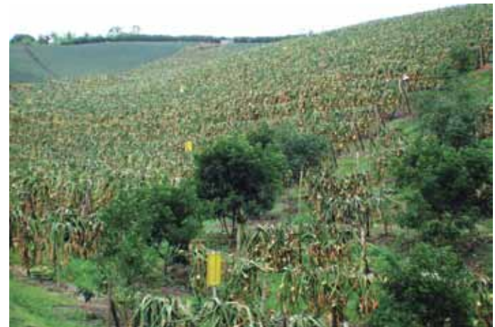
Figura 1. Panorámica del cultivo de pitahaya en floración.

En una misma planta pueden coincidir, en un momento determinado, varias fases de desarrollo: frutos maduros, frutos con 12 a 20 días de desarrollo, flores a punto de abrir, flores con dos días después de la floración y yemas florales recién iniciadas (Barbeau, 1990).