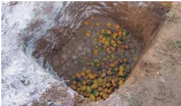
Figura 23. Recolección y proceso de eliminación de frutos afectados.