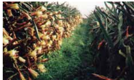
Figura 5. Floración.