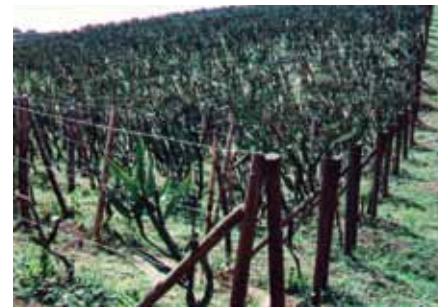
Figura 11. Cultivo de pitahaya con buena formación y al día en podas.

labores de podas. La poda de formación consiste en eliminar los brotes de la penca principal, hasta una altura aproximada de 60 cm de la superficie del suelo. La poda de mantenimiento o entresaque consiste en eliminar los tallos improductivos, que evita el peso excesivo de la planta sobre los tutores y facilita la circulación de aire. La poda sanitaria consiste en eliminar los tallos enfermos para evitar la diseminación de patógenos. En los diferentes tipos de podas es necesario desinfectar la herramienta al pasar de una planta a otra y aplicar una pasta cicatrizante en las heridas.