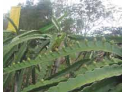
Figura 3. Inicio de floración.