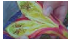
Figura 21. Daño interno del botón floral.