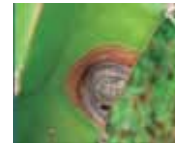
Figura 18. Síntoma de antracnosis en penca.

La antracnosis es una enfermedad fungosa que ataca pencas y frutos. Se han reportado incidencias en el país del 16,6% (Araujo y Medina, 2008). Los síntomas inician con pequeñas manchas circulares de color marrón, que al avanzar en el tejido presentan lesiones de color negro, con aspecto hundido y seco; en ataques severos la parte afectada de la penca se desprende dejando huecos, lo que disminuye el área foliar para el proceso fotosintético y afecta el tamaño de los frutos.