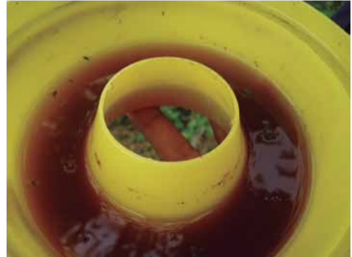
Figura 27. Trampa Macphail.