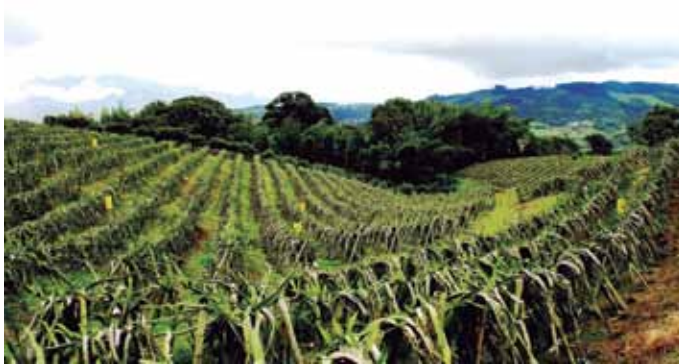
Figura 2. Panorámica del cultivo de pitahaya en floración.