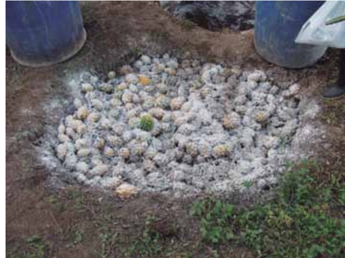
Figura 24. Recolección de frutos afectados.