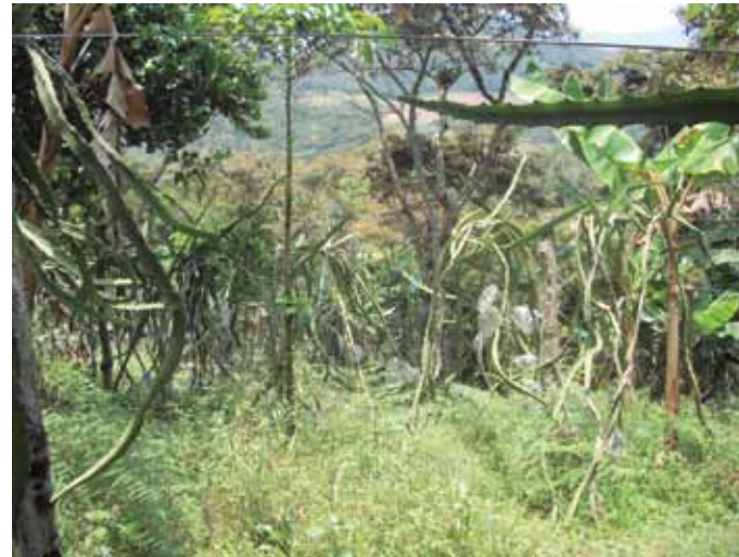
Figura 13. Cultivo de pitahaya sin control de malezas.

Las arvenses generan pérdidas en los sistemas de producción por la competencia por nutrientes, luz, agua y espacio que tienen con la planta; además, aumentan la humedad relativa creando microclimas que favorecen el establecimiento de patógenos y algunas son hospederas de plagas y patógenos. Las arvenses pueden ser muy perjudiciales para el cultivo de la pitahaya, principalmente en las primeras etapas de la plantación, inmediatamente después de la siembra o el trasplante, dado que en esta fase la planta está muy pequeña y en período de adaptación no toleraría una alta competencia por nutrientes (Agronet, 2003). El manejo de arvenses se debe realizar con las prácticas de plateo de las plantas, el control mecánico con machete o guadaña, el establecimiento de arvenses nobles y el uso de herbicidas registrados.