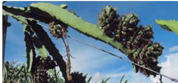
Figura 7. Frutos en formación.