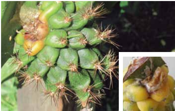
Figura 14. Síntoma de Fusarium Oxysporum Schldt. en frutos.