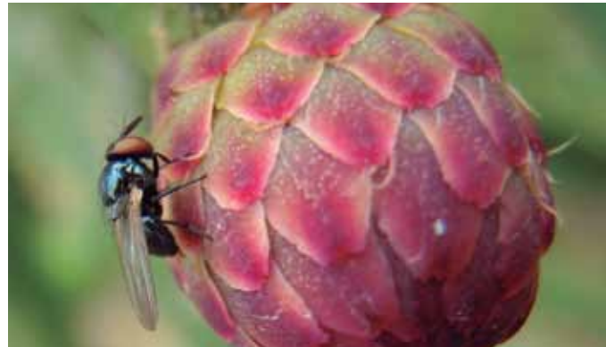
Figura 20. Mosca del botón floral. Fuente: Kondo, T., en: Delgado et al, 2010.

Los huevos son hialinos, no translucidos, permanecen en este estado pocos días; luego cambian a un color blanco cremoso y, después de la eclosión, miden entre 1 a 2 mm. Las larvas son de color blanco a blanco amarillento a medida que van creciendo; pasan por tres instares en un ciclo de 9 días. Antes de empupar, las larvas se entierran a un centímetro del suelo; la longitud de las pupas es de 4,5 mm y pueden durar entre 5 y 13 días hasta la emergencia del adulto. Los adultos son moscas pequeñas, de aproximadamente 5 mm de longitud, de color azul metálico brillante, que tienen un ciclo de 8 días. La hembra posee un ovopositor retráctil y pronunciado en forma de lanza. El ciclo total de D. saltans tiene un rango de 16 a 29 días (Delgado et al, 2010).