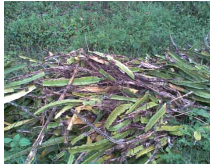
Figura 22. Poda sanitaria de pencas.