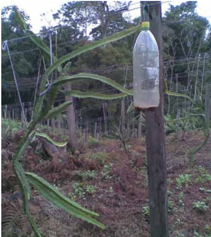
Figura 12. Trampa casera para mosca.

El monitoreo es la labor destinada a estimar la presencia, la abundancia y la distribución de las plagas y enfermedades y consiste en realizar con frecuencia (por ejemplo, semanalmente) un recorrido en el lote para monitorear la presencia de plagas y enfermedades, además de revisar las trampas, como en el caso de la trampa para la mosca de la fruta.