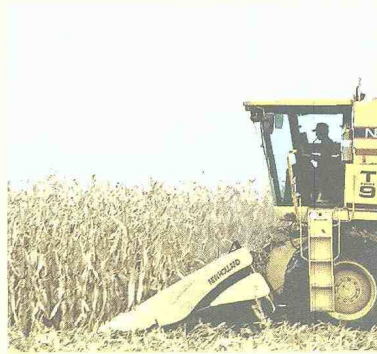
El auxilio del Gobierno Nacional es para 134.000 toneladas de maíz.