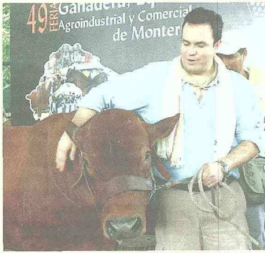
Recursos para financiar los proyectos: ministro Andrés Fernández.