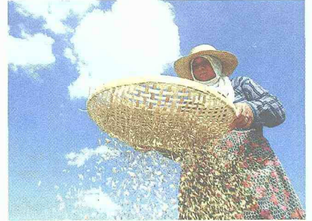
En la temporada 2010-2011, la producción de trigo bajaría a 656,37 millones de toneladas.

Mientras tanto, la cosecha global de maíz para el período 2010-11 crecería a 804,20 millones de toneladas, desde 784,05 millones.