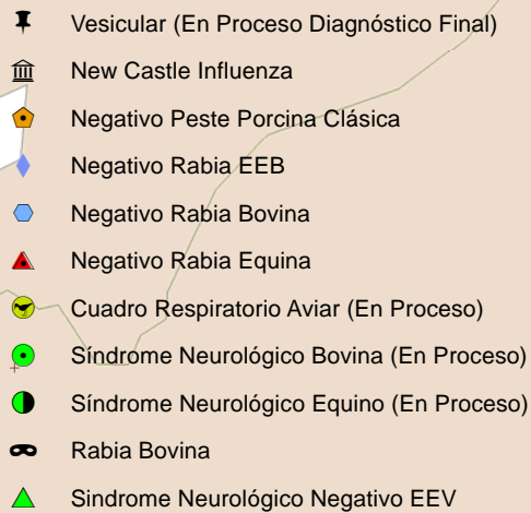
Mapa de Ocurrencia de Enfermedades de Declaración Obligatoria. Colombia Semana 49 de 2010