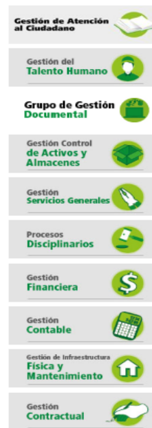
Foto estructura organizacional Subgerencia Administrativa y Financiera – Grupo de Instrucción Disciplinaria página WEB ICA