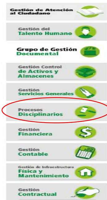
Foto estructura organizacional Subgerencia Administrativa y Financiera página WEB ICA

Inicio > Subgerencias > Sub. Administrativa y Financiera >