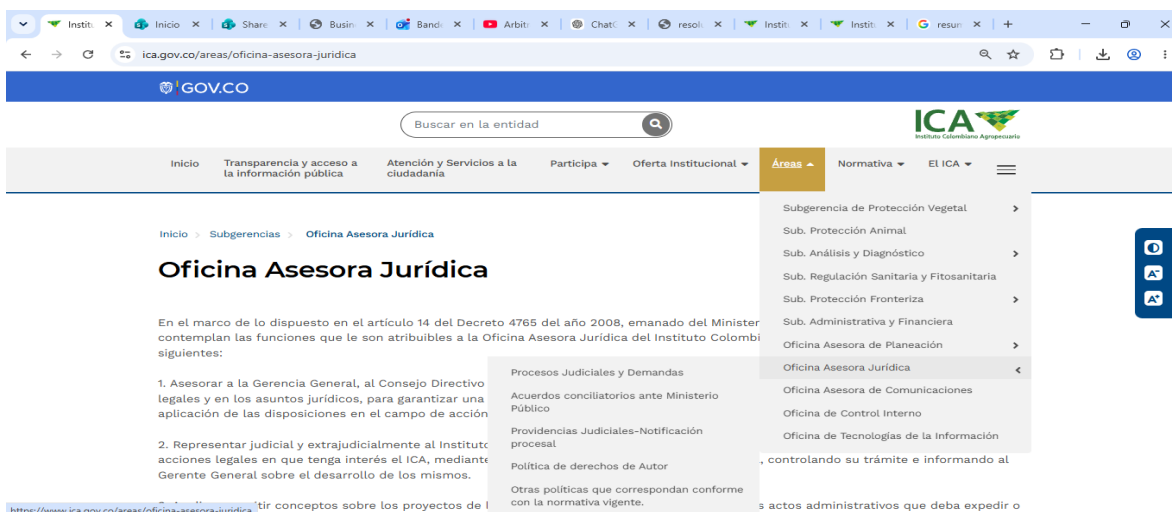
Foto Areas/ Oficina Asesora Jurídica página WEB ICA

4. No se ha actualizado el grupo interno de juzgamiento adscrito a la Oficina Asesora jurídica en la página web institucional: https://www.ica.gov.co/areas/oficina-asesora-juridica