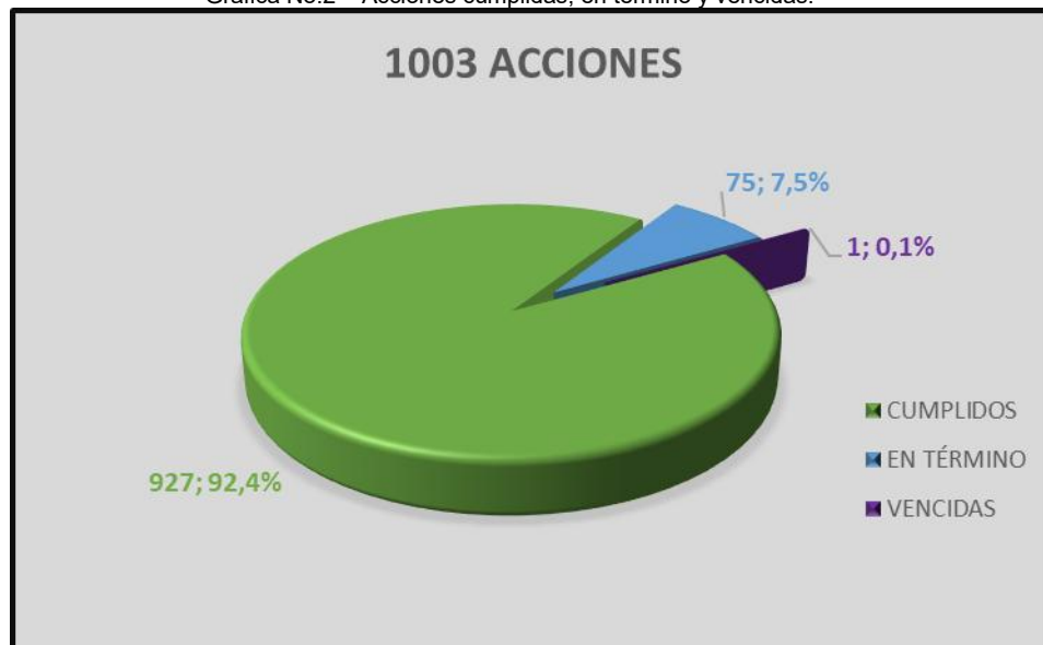
Gráfica No.2 – Acciones cumplidas, en término y vencidas.