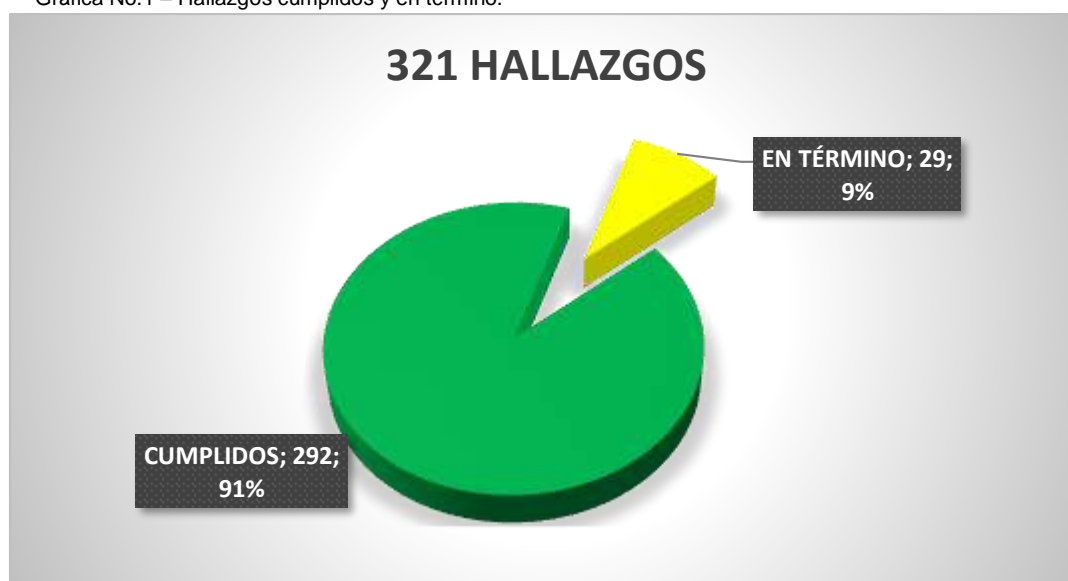
Gráfica No.1 – Hallazgos cumplidos y en término.