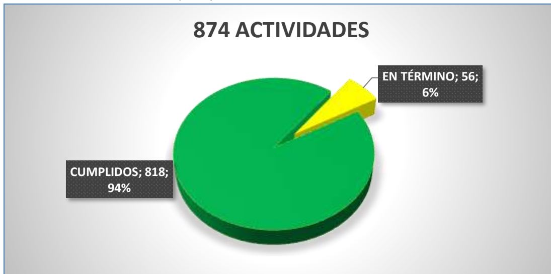
Gráfica No.2 – Actividades cumplidos y en término.