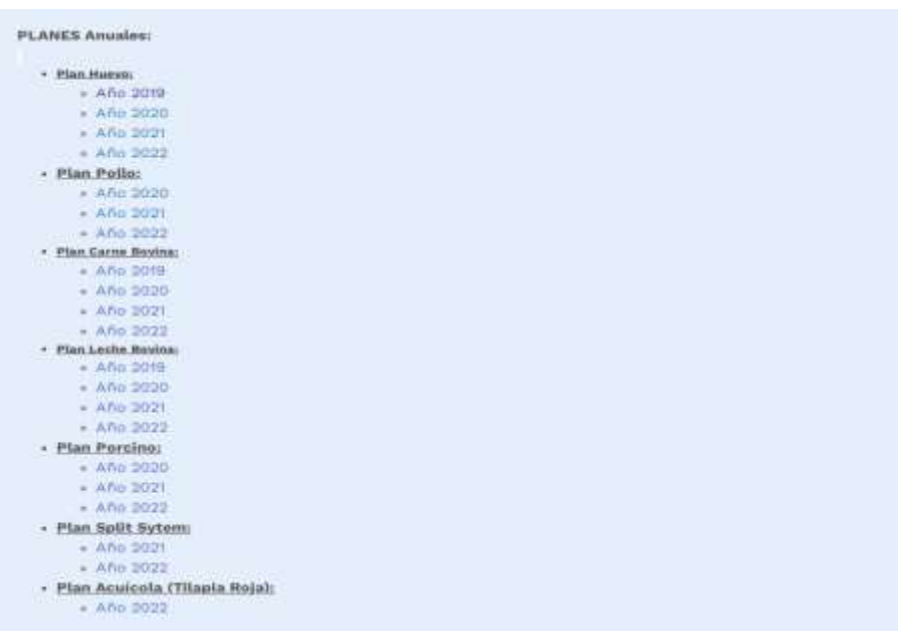
Imagen 1

Así mismo no se evidenció que el Instituto este aportando la información relacionada con los resultados que se obtienen en los diferentes planes subsectoriales, a fin de que se garantice lo establecido en la Ley 1480 de 2011, donde se señala que “ los consumidores y usuarios tienen derecho a la seguridad e indemnidad, el cual se traduce en que los productos no causen daño en condiciones normales de uso y a la protección contra las consecuencias nocivas para su salud, vida e integridad ” .