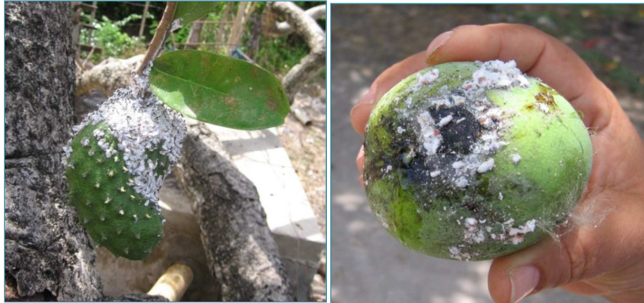
Figura 3. Daños causados por cochinilla rosada del hibisco (CRH) Maconellicoccus hirsutus (Green) en frutos de guanábana y mango en Providencia (San Andrés y Providencia).

La cochinilla rosada del Hibisco - CRH - Maconellicoccus hirsutus (Green), es una plaga polífaga que puede tener un impacto muy importante sobre el turismo, agricultura, ecología y comercio de material vegetal a escala regional y mundial (ICA, 2011).