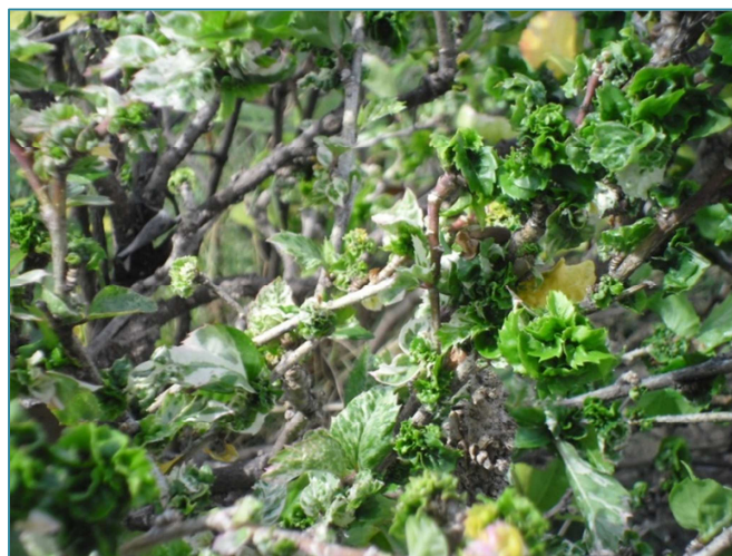
Figura 2. Daños causados por cochinilla rosada del hibisco (CRH) Maconellicoccus hirsutus (Green) en cayeno en San Andrés (San Andrés y Providencia).

Las hojas pueden tomar forma de roseta o tornarse rizada (Figura 2). Los brotes jóvenes se observan torcidos y enrollados (Martínez, 2007).