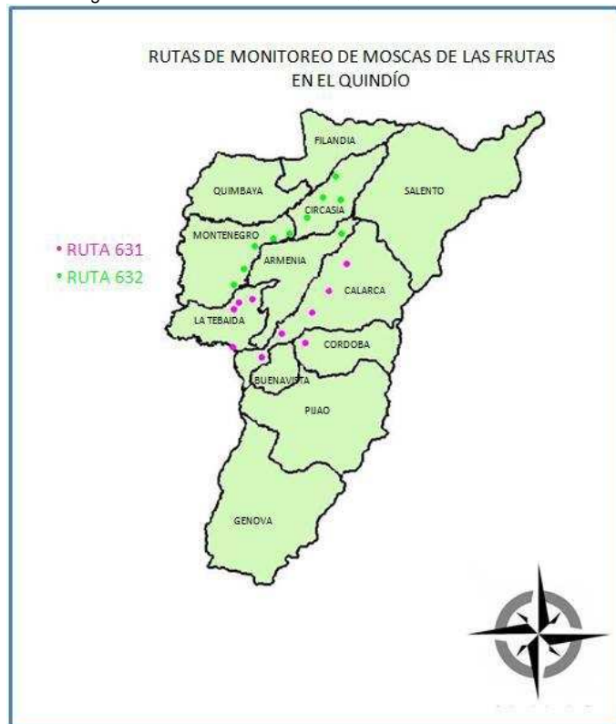
Figura 1. Rutas de monitoreo del Quindío