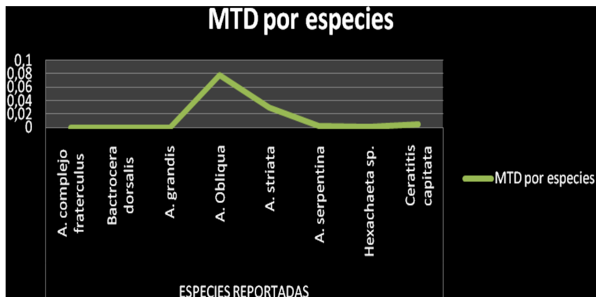
Grafico 1. Representación gráfica de los Indices MTD por especies capturadas durante el primer trimestre de 2011 en rutas de monitoreo en el departamento del Magdalena.