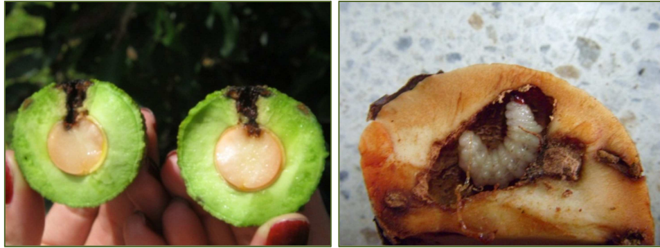
Figura 2. Daños causados por Heilipus sp. en fruto y semilla.

En el sitio de perforación se observa savia cristalizada, secreciones blancas y excremento del insecto. En su estado larval pueden barrenar tallos, en árboles jóvenes pueden causar la muerte (Castañeda-Vildózola, et.al. , 2007). Se reportan daños tanto en variedades criollas como mejoradas (CESAVEM, 2008).