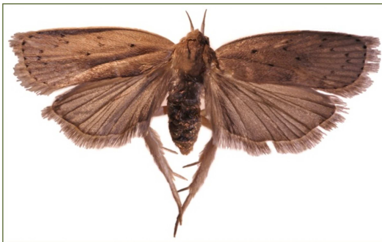
Figura 3. Adulto de S. catenifer .

El adulto es una polilla de color café claro, con una longitud promedio de 15 mm para la hembra y 11 mm para el macho, las alas anteriores son el doble de largas que anchas (Figura 3). Cuando está en reposo, sobre las alas se observan alrededor de 25 manchas de color negro que forman una "S" acostada (Hohmann et al. , 2000).