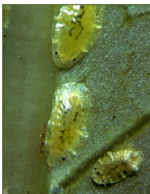
Figura 5. Hembra adulta de C. viridis .

El insecto pasa por varios estados de desarrollo o instares previos al estado adulto. En estado inmaduro o de ninfa tiene un tamaño aproximado de 1 mm, es ovalado y muy móvil (Poole, 2005). Sin embargo, su habilidad de dispersión es baja según Tandon y Veeresh (1988).